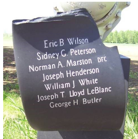
Foto's monument in Hank