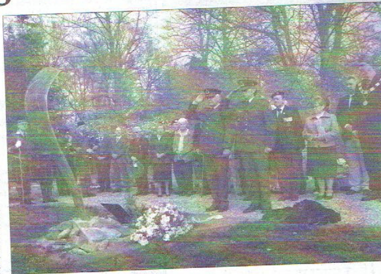
De plechtigheid bij de geplaatste cenotaaf.

Nadat de beplanting rond de graven werd aangepast, werden twee vlaggenmasten geplaatst en kon het propellerblad worden geplaatst. Het propellerblad was afkomstig van een berging in september 2005 van een Halifax, die in de nacht van 24 op 25 mei 1944 op de terugweg van een aanval op Aken was neergestort